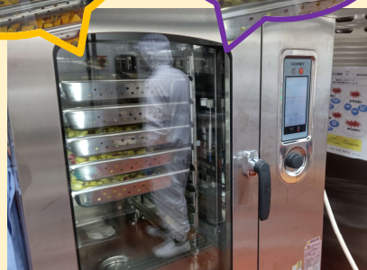
↑ スチームコンベクションオープン