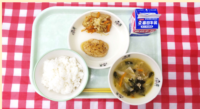
↑今日の給食時間の放送原稿