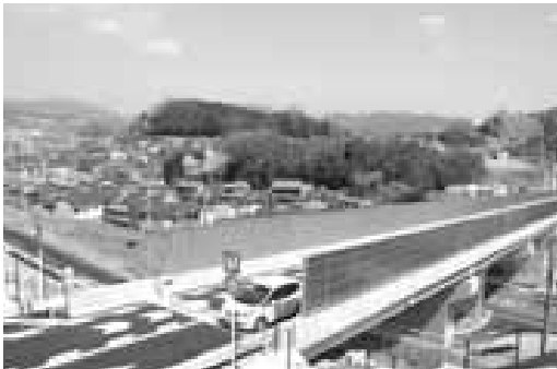
▲王寺香芝線が全区間開通し利便性が向上しました