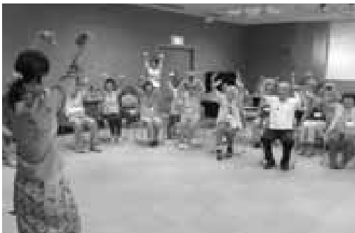
▲介護予防教室「ちゃれんじ健康教室」の様子