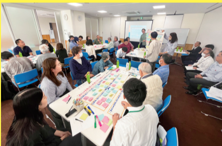
昨年10月「本町エリアの未来を考える住民ワークショップ」

やりたいな」をサポートし、「この指とまれ」で人が集まり、本町エリアの未来をつくる事業をみんなで行うことができるのです。