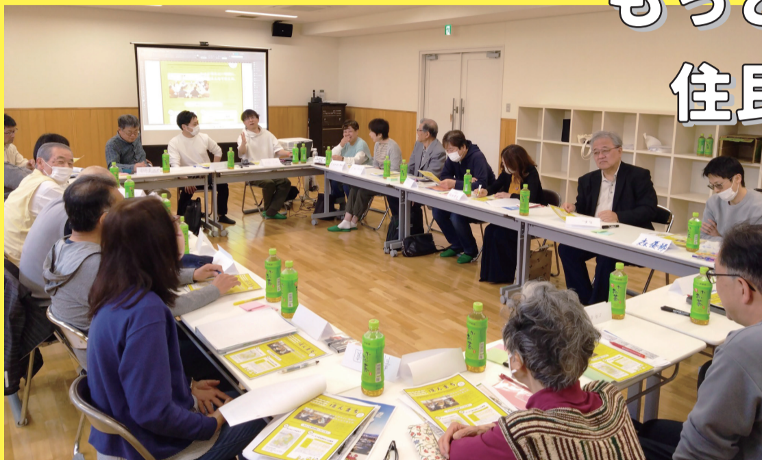
いずみスクエアで月に1度、会議を行っています。参加したい人は裏面をチェックしてください

私 たちが住む王寺町本町エリアでは、16の自治会をはじめ、多様な団体が地域活動を行っています。けれども、人口減少や働き方の変化等により交流機会が減少し、つながりの希薄化が大きな課題となっています。