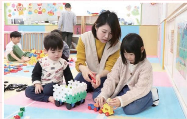
▶ こどもたちもママがそばにいたので、安心した様子で過ごしていました。