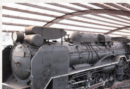
煙突に取り付けられた集煙装置

装置は、上部に蓋があつて開閉でき、普段は蓋を開けた状態で煙を上方に排出させますが、トンネル内では蓋を閉めて後方に排出させ、煙が充満しないようにして、乗務員が一酸化炭素中毒になるのを防ぎます。