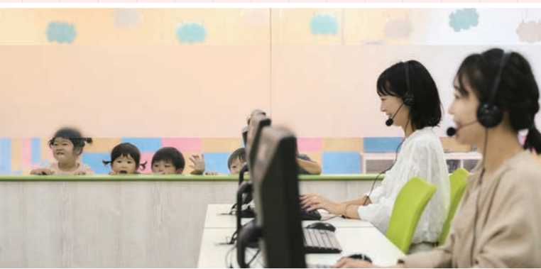
▶ キッズスペースからママを見つめるこどもたち。お仕事中のママはカッコいい！

一緒に働く仲間は、同僚というよりも悩みや情報を共有できる「ママ友」みたいな存在です。