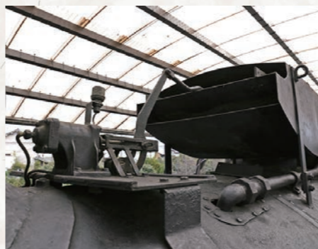
後方から見た集煙装置 写真左手の機器で上部の蓋を開閉します

895号機には、煙突の上に箱形の集煙装置が被せられたまま保存されているのが特徴です。集煙