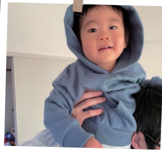
あきと 煙人ちゃん R4.2.15 生