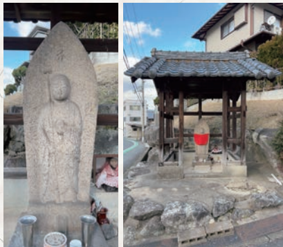
大田口にお祀りされる九本柱の地蔵さん

大田口自治会内のところ、県道畠田藤井線から国道25号の「神前橋西」交差点に向かう道沿いに、お地蔵さんがお祀りされています。 このお地蔵さんは、高さ約1.2m、最大幅約44cmの舟形に整えられた石に浮き彫りされたもので、右手に錫杖、左手に宝珠を持ち、お立ちになったお姿で表現されています。お地蔵さんの右脇に、「元禄十五年」と刻まれていることから、江戸時代の元禄10年（1697）につくられたことがわかります。 昭和44年（1969）に刊行された『王寺町史』によれば、「九本柱の地蔵さん」と呼ばれ、九本柱で南向きの地蔵さんは日本に3か所しかないといえ、篤く信仰されました。この名前は、おそらく覆い屋が9本の柱で建てられていることに由来しているのでしょう。 また、『王寺町史』によれば、子どもが好きなお地蔵さんで、子宝に恵まれるといい、お顔の鼻の先が欠けてい