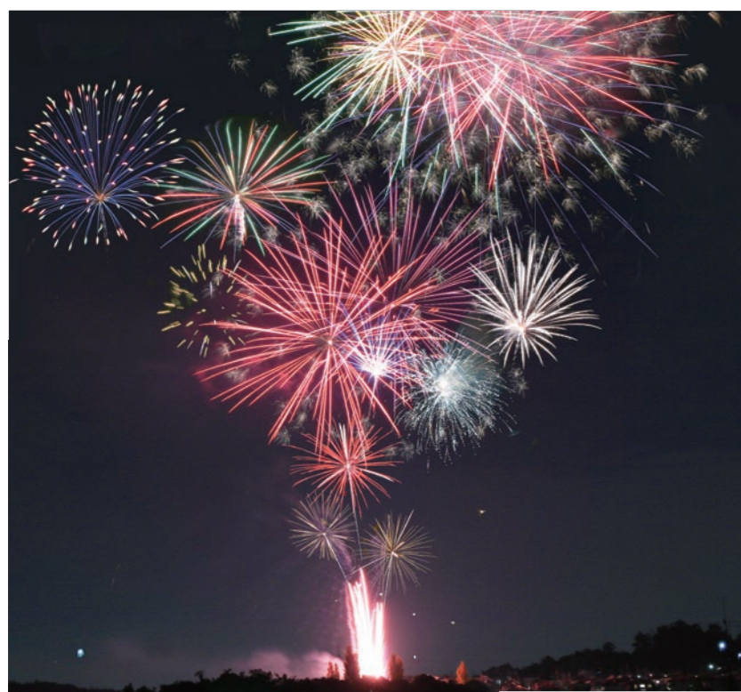
王寺ミルキーウェイ 2023 のフィナーレを飾る花火

結びに、皆様方のますますのご健勝と、ご多幸をお祈りし、年頭のあいさつといたします。