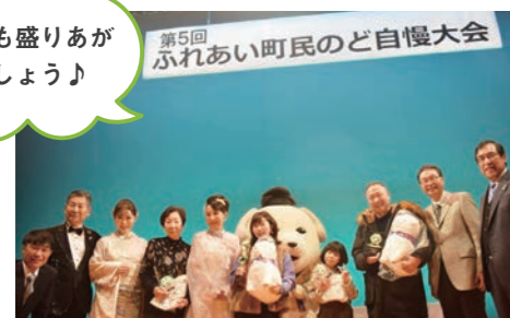
前回(第5回)大会の入賞者たちとゲスト審査員、司会者、ゲスト歌手、町長、雪丸