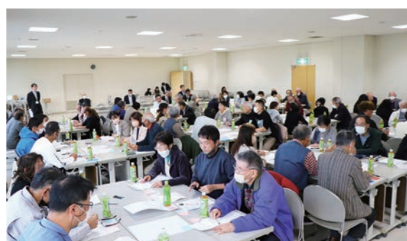
「まちづくり協議会」設立に向けたワークショップの様子