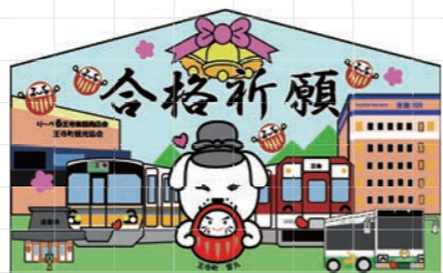
JR 王寺駅職員さんデザインの絵馬