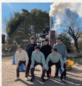
ロケットストーブを製作した王寺工業高校の生徒さんたち（明神山にて）

烽火はロケットストーブという装置で上げ、これを王寺工業高校の生徒さんが製作してくれました。みんなが「烽火つて見えるんだ！」と感動したプロジェクトでした。