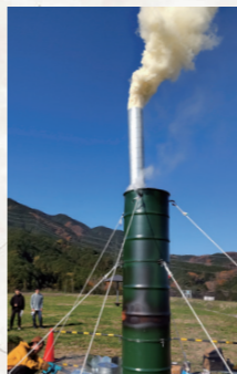
葛城市しあわせの森公園で勢いよく上がる烽火

烽火の発信地点となるのが明神山で、受信地点とした明日香村の甘樫の丘までは約16kmあります。当日も霞がかかっている、明神山からは甘樫の丘を視認することができ