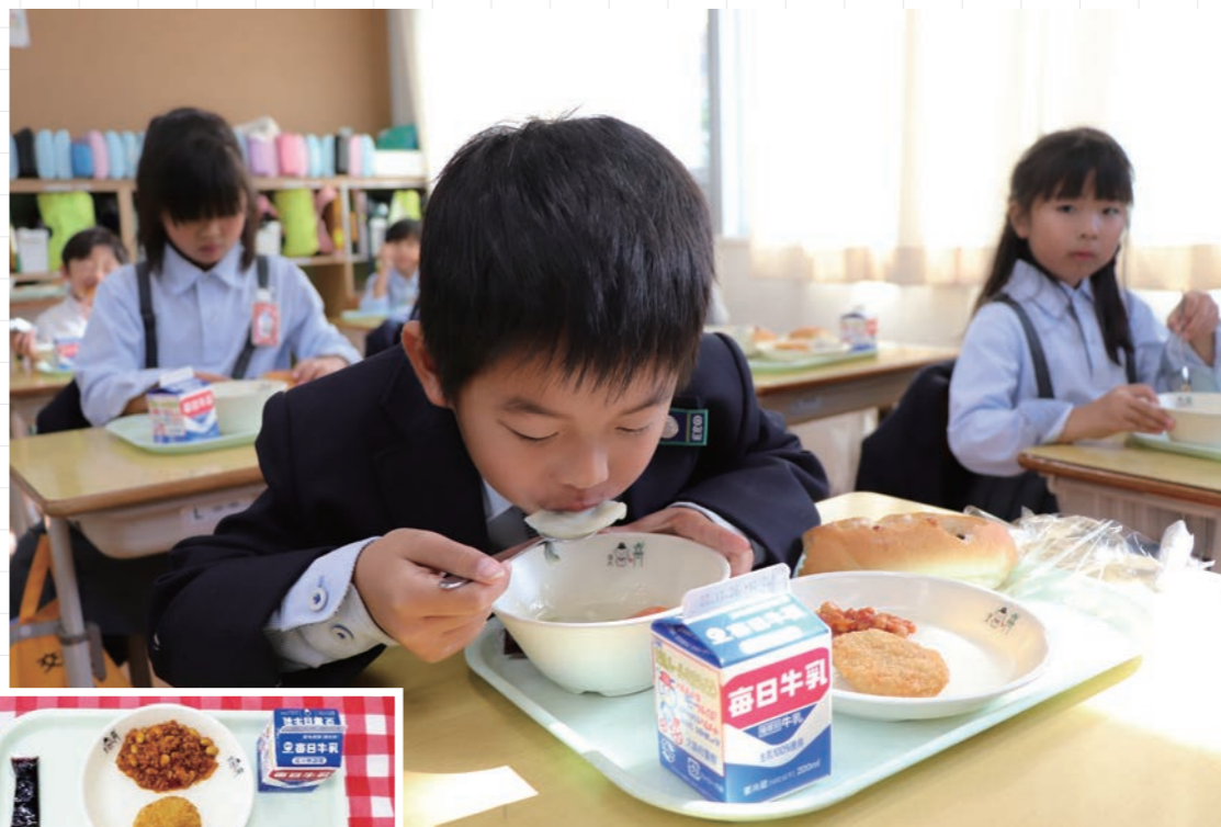
◀ 11月16日(木)の献立: 規格パン、牛乳、カツオカツ、チリコンカン、王寺のさつまいものクリームシチュー、奈良のブルーベリージャム

11月16日(木)、児童たちが収穫したさつまいもが学校給食に初登場しました。 メニューは「王寺のさつまいものクリームシチュー」。約40kgのさつまいもを調理員の皆さんが丁寧に洗浄、愛情を込めて調理しました。実際に給食を食べた児童たちは、「甘くておいしかった!」「畑の味がした!」としっかり味わって食べていました。 このさつまいもは、5月18日(木)に北・南義務教育学校の1年生が、葛下3丁目の遊休農地で農業委員の皆さんのご指導のもと約500本の苗を植え付け、草刈りや水やり等の管理をしていただき、10月26日(木)に児童たちが収穫体験をしたものです。 たくさん大きなさつまいもを収穫することができ、約2,500食分の学校給食に活用することができました。