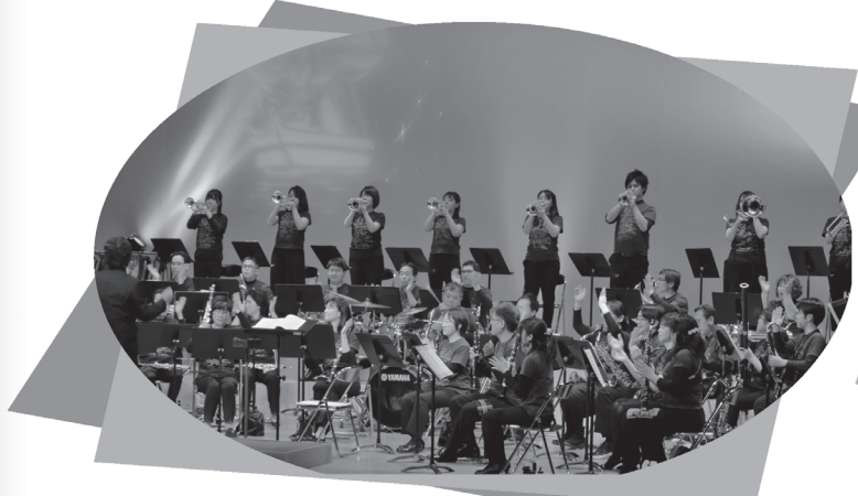
セントシンディアンサンブル