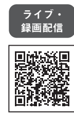
ライブ・録画配信

本会議はリアルタイムでライブ配信するほか、役場1階表玄関のテレビでも中継を行います。また後日、録画配信でも視聴できます。