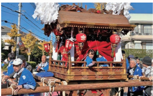
王寺町社会福祉まつりでの「太鼓台」曳行と展示