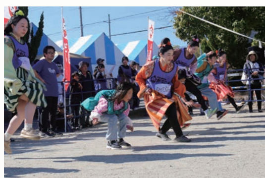
第5回全国だるまさんがころんだ選手権大会 決勝大会