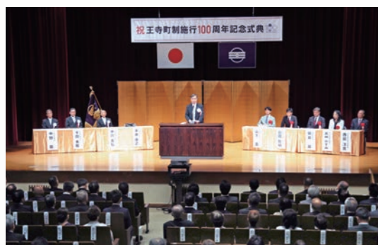
王寺町制施行100周年記念式典