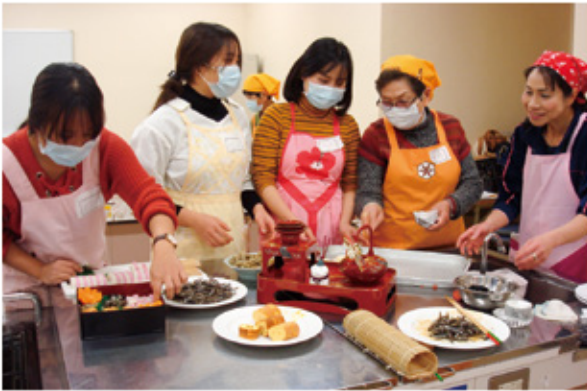
▲和気あいあいと、互いの交流を楽しみました。

12月16日(土)、地域交流センター調理実習室で、白鳳短期大学で学ぶ留学生を対象に、国際交流セミナーの一環として『おせち料理作り』を開催しました。タイやベトナムなど4ヶ国の留学生11名が、王寺町食生活改善推進員の皆さんの指導のもと、伝統料理「おせち」の由来などを学び、田作りや伊達巻といった8品を一の重、二の重、三の重ごとにグループに分かれて作りました。出来上がった料理は重箱に詰められ2時間で完成。留学生から喜びの声が上がりました。