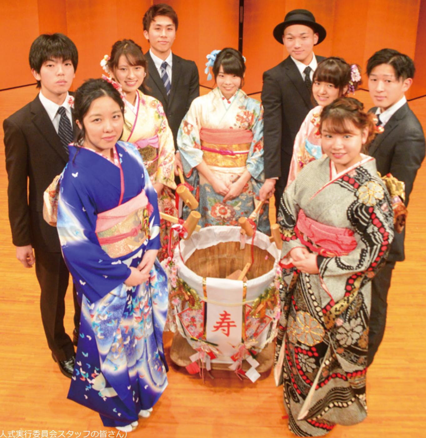
(成人式実行委員会スタッフの皆さん)