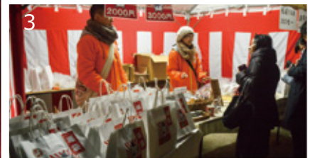
1_ 例年より多くの人でにぎわった境内。2_ あつあつのお餅をどうぞ。3_ 限定雪丸グッズ、お買い上げ！ 4_ 厳かな雰囲気で行われたお焚き上げ。5_ 2018年もいい年でありますように。