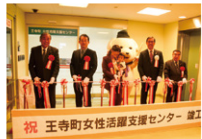
▲竣工式典でのテープカットの様子。

『王』 寺町女性活躍支援センター』が12月18日(月)にりーべる王寺東館4階にオープンしました。施設内には、テレワークにより子育てをしながら柔軟に働くことができる環境整備を図ることを目的に、託児の場を併設したワークスペース「ママスクエアりーべる王寺店」が開設されました。同館5階にはハローワークや保健センター、民間の乳児センターが併設されていることから、女性の就労支援とともに、子育てにおけるさまざまなニーズにワンストップで対応できることが期待されます。