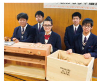
▲製作した吉野高校1年生の皆さん。

県 立吉野高校の建築工学科と木工芸部の生徒10人が製作した木製おもちゃが、王寺町内の幼稚園・保育園に寄贈され、その贈呈式が12月13日(水)にやわらぎ会館で行われました。「吉野の木」の良さを知ってもらおうと同校生徒が企画し、サクラ、スギ、ヒノキ、クリの木を使用し、約5か月かけて、積み木2千ピースと収納箱5つ、ままごと用のキッチンシェルフ3台を製作されました。生徒たちは、「園児たちに笑顔で楽しく安全に遊んでもらいたい」と話していました。