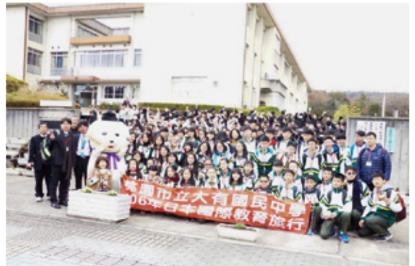
▲南中学校の校門前で記念撮影。

12月5日(火)、台湾・桃園市立大有国民中学の生徒約50人が、将来の訪日観光リピーターになってもらう目的で県観光プロモーション課が県内各地の学校で実施している事業の一環で王寺南中学校を訪れ、交流を深めました。体育館で行われた歓迎式典では、「雪丸ドローン」が登場し、台湾の生徒たちからは、「犬が空を飛んでいる」と驚きの声が上がりました。また、授業や給食も共にし、日本文化の体験や、日台の生徒同士の交流を図りました。