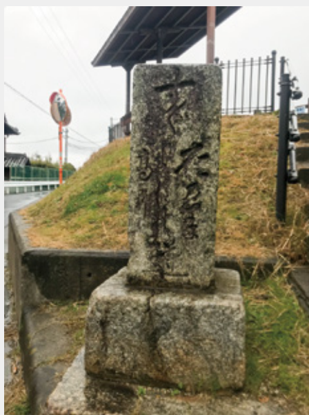
▲芦田池のそばに残る道しるべ。

この道しるべは、江戸時代に当麻街道として利用されていた道。現代でいえば、道路の案内標識にあたり