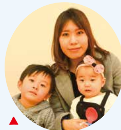
▲ あん 杏 ちゃん ハジメ ちゃん(4才) いつもニコニコげんき パワーをありがとう!