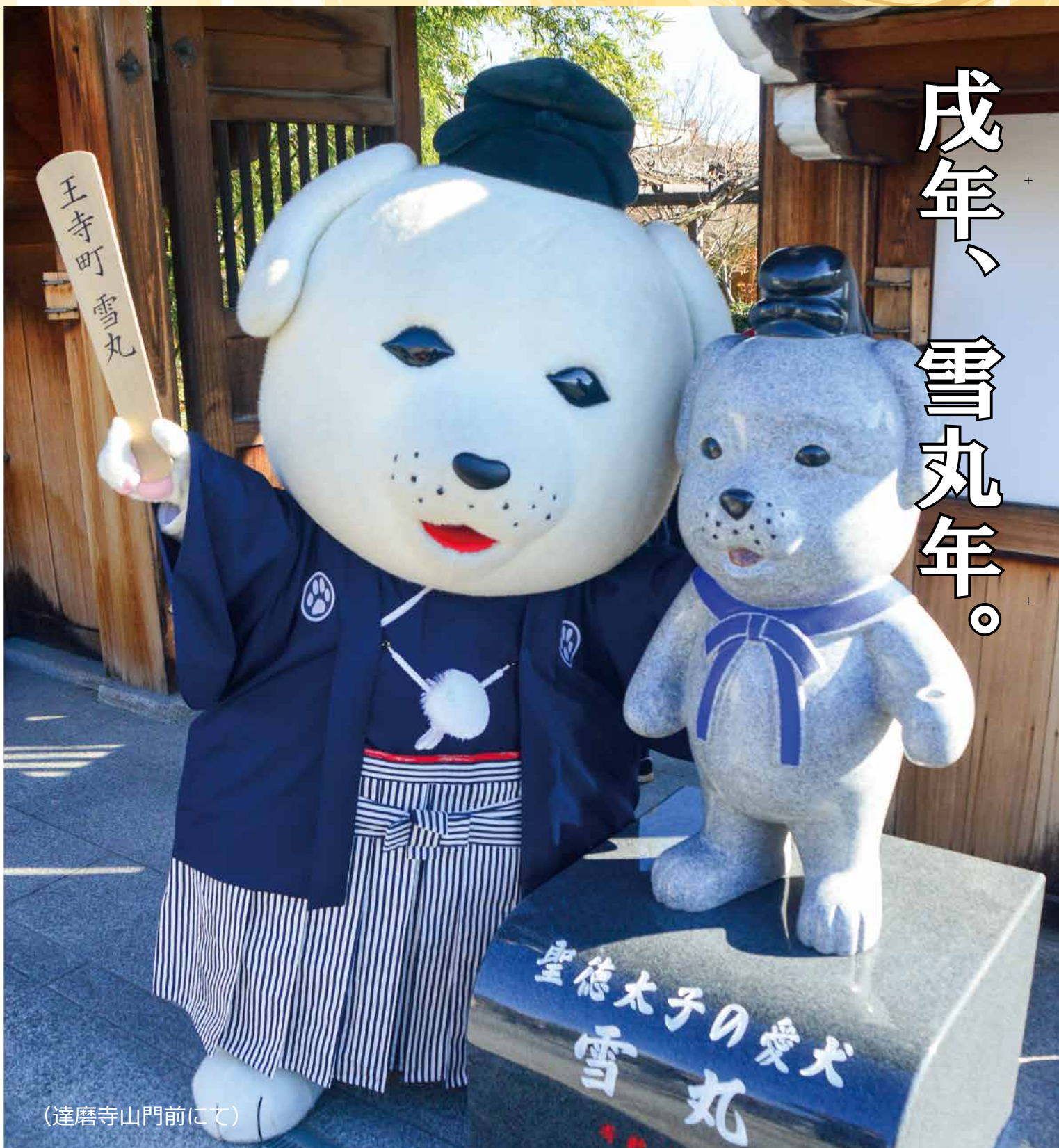
(達磨寺山門前にて)