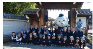
▲片岡の里保育園の子どもたちも大喜び。