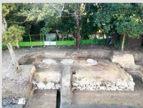
▲発掘調査で確認した西安寺の塔跡

塔は土を盛って一段高くした基壇の上に建てられます。その基壇の外側を飾るのが基壇外装で、乱石積とは自然石をうまく組み合わせて積み