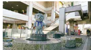
▲駅前の待ち合わせ場所にいかが。

モニュメントは御影石できており、高さ約1メートル、重さは約300kgにもなります。設置場所は達磨寺山門前と、JR王寺駅北側の2箇所。合格必勝・安産祈願・無病息災・ペット健康祈願・諸願成就の願いが込められていますので、ぜひモニュメントを撫でながらお祈りください。