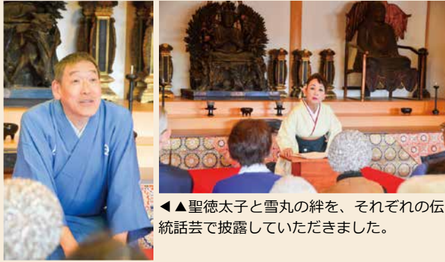
◀◀聖徳太子と雪丸の絆を、それぞれの伝統話芸で披露していただきました。