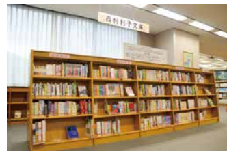
▲図書館入り口から左手奥に。