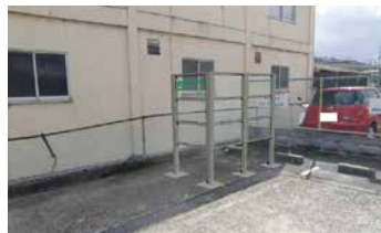
◀▲JR 畠田駅近くに、看板と喫煙場所を設置しました。皆さまのご協力をお願いします。