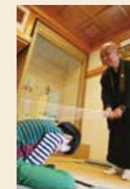
本堂では坐禅体験も実施されました▶