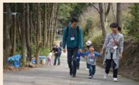
▲みんな仲良く、力を合わせて山頂まで登りました