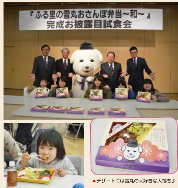
▲デザートには雪丸の大好きな大福も♪

ボリュームたっぷり、ワンコインの500円(税抜き)の雪丸おさんぽ弁当をみなさんぜひご賞味ください。