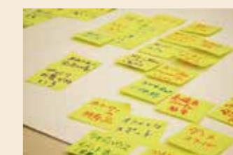
▲◀それぞれの班が思い描いたミライをこれから形にしてみましょう