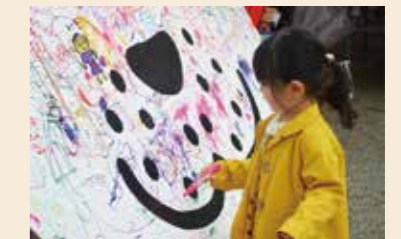
▲境内に設置されたBIG雪丸願い札。子どもたちは思いのお願いを書き込んでいました。みんなの願いが叶いますように