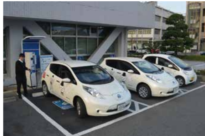
▲ラッピングされた電気自動車は、LEAF（日産自動車）2台とiMiev（三菱自動車）1台の合計3台

このたび、王寺町公式マスコットキャラクター「雪丸」のラッピングが施された電気自動車が登場。公用車として使用しながら、町の魅力のPRに取り組むとともに、環境にやさしいおもてなしの空間づくりに向けての機運をまち全体で作り上げます。なお、電気自動車の購入にあたっては国の交付金（1/2補助）を活用しています。