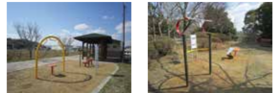
▲運動前後のストレッチなどにご利用ください