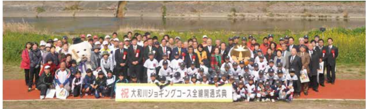
▲3月19日に開催された全線開通式典では、走り初めも行われました