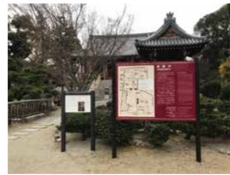
▲リニューアルした案内板