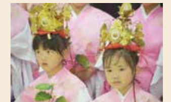
▲稚児衣装をまとった園児たち ◀会場に大爆笑が巻き起こった達磨さんがころんだ（セクシーver）