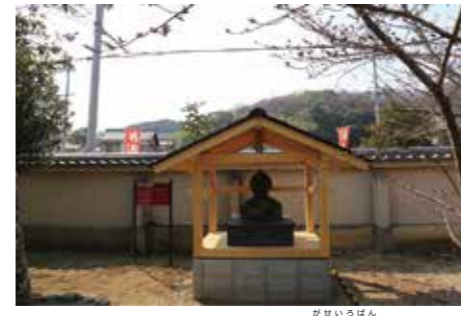
▲新たに展示した「達磨寺旧本堂瓦製露盤」

午前10時から午後3時まで無料で見学することが出来ます。土・日曜日、ボランティアガイドの方の案内もあります。 そして、三つが境内の文化財案内板です。本堂の外にも重要文化財をはじめとする多くの文化財があり、これまでも案内板が設置されていましたが、かなり傷んできていたため、今年の3月にリニューアルしました。新しい案内板は、外国の方にも