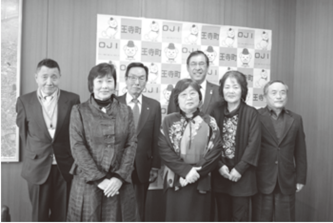
▲ 1月6日に新役員の方々が表敬訪問に来られました。

地 域の身近な相談相手である、民生委員・児童委員の一斉改選が行われ、新任、再任される41名の方々が厚生労働大臣より委嘱されました。