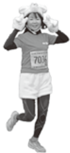
▲コスチュームを着ながら走る人たちの中には雪丸に扮装する方も。