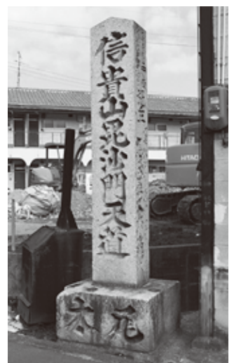
▲ 道標②に刻まれた「尾太」