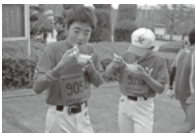
▲温かいぜんざいで疲れた体も癒されました。

健康マラソンの部では、親子での参加が多くみられ、家族でマラソンを楽しまれている様子が印象的でした。また、当日は焼き餅入りぜんざいのふるまいもあり、ランナーの方々は舌鼓を打っていました。