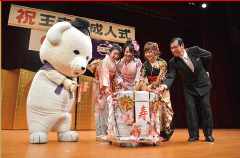
▲記念行事の最後には鏡割りも行なわれました。「せ～の！」

一生に一度しかない成人式。久しぶりに会う友人や恩師との会話を楽しみながら、このよき日の思い出と未来への希望を、胸に抱いたことでしょうか。これまでに培ってきた経験を活かし、これから自らの手で切り開く新しい道に向かって、この町で育った新成人は、歩み始めました。皆さんの前途に輝かしい未来がありますように。ご成人、誠におめでとうございます。