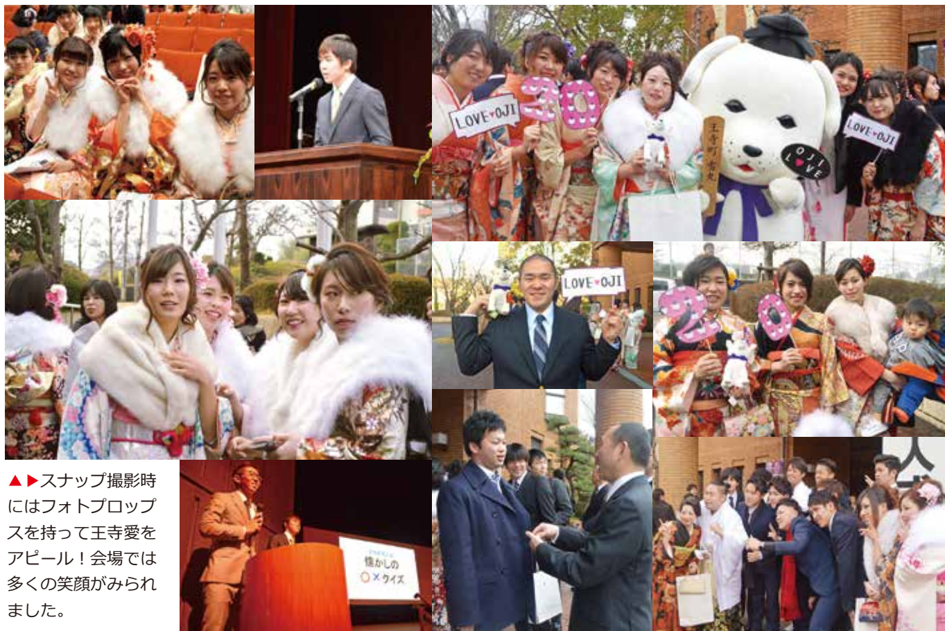
▲▶スナップ撮影時にはフォトプロップスを持って王寺愛をアピール！会場では多くの笑顔がみられました。

澄 み切った晴れやかな青空のもと、開催された成人式。新成人スタッフ自らが、同じ門出を迎える新成人たちの受付を行いました。