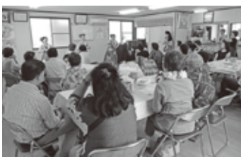
▲みその自治会館でのサロンの様子

今後より多くの方に気軽に参加していただけるよう、開催場所の拡充に努めてまいります。