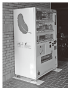
▲赤い羽根自動販売機(文化福祉センター前)

赤い羽根のマークがついた自動販売機を見かけましたら、ご協力よろしく、お願いいたします。また、自動販売機を設置していただける法人、企業、団体、個人の方も随時募集しています。