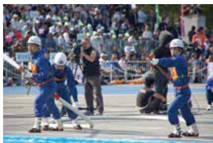
▲平成20年には第1分団が全国大会に初出場