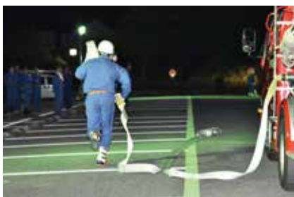
▲2回目の全国大会出場を目指します