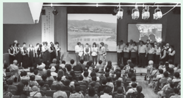
▲300人もの方々にお越しいただきました

雪丸とともに平井町長もステージで共演。会場のみなさんと共に「蘇州夜曲」を熱唱する場面も