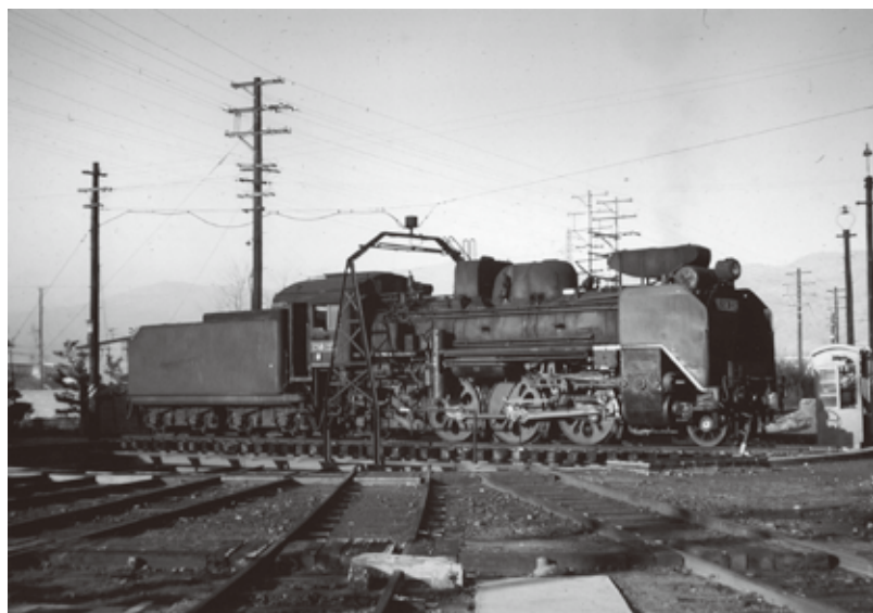
▲ 機関車を転車台にのせて“ぐるり”と方向転換

王寺駅の転車台は、おもに王寺駅で折り返し運転を行う蒸気機関車を方向転換させるためにあり、今の電車は方向転換させなくても