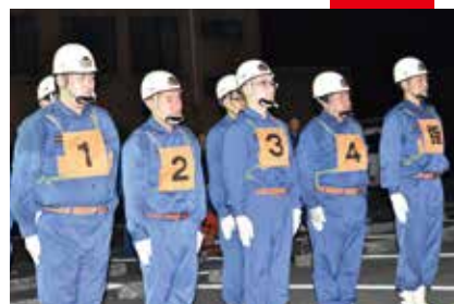
▲出場する第5分団員