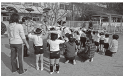
▲ 訓練に真剣に取り組む園児たち

阪神淡路大震災から21年目を前に、王寺北幼稚園では、1月16日(土)の休日参観日に、地震を想定した避難訓練の後、教育講演会を開催し、慌てずに避難するために必要な防災知識や『防災ハザードマップ』について、王寺町職員から詳しく教わりました。また、講演会后、非常食の試食も行いました。保護者からは、「防災についてもっと家族で話し合わなければと感じました。」「ハザードマップは地域を知る大切な情報源だと思いました。」「まず、自助がしっかりできるよう、我が家も試食した非常食と同じ物を備えようと思います。」「などの意見がありました。自分の命は自分で守る意識をもつことや防災について家族みんなで考える良い機会となりました。