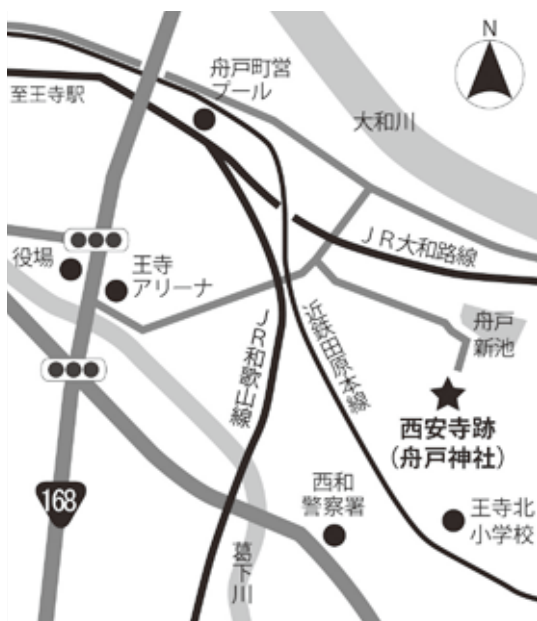
▲ 西安寺跡の舟戸神社へは、王寺駅から徒歩約15分。王寺町役場から徒歩約10分です