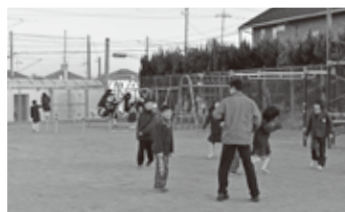
休み時間はスタッフと一緒に遊びました