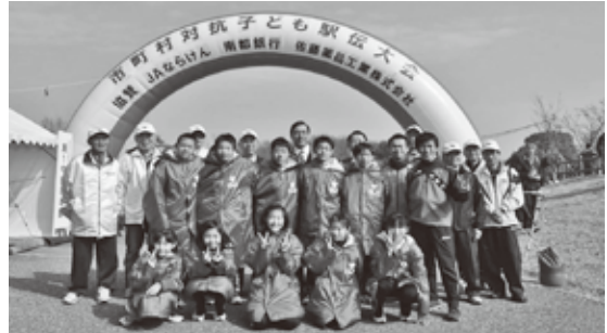
▲王寺町代表として、頑張りました