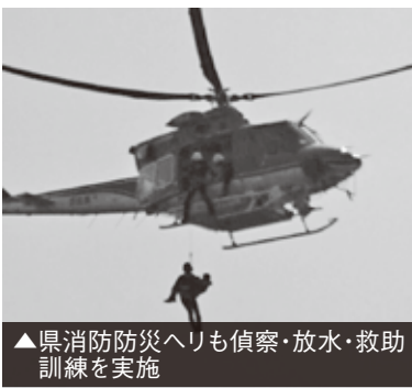
▲県消防防災ヘリも偵察・放水・救助訓練を実施