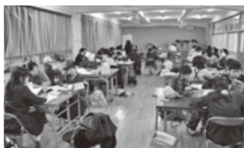
たくさん参加してくれました