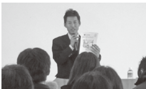
▲ 職員による『防災ハザードマップ』についての解説