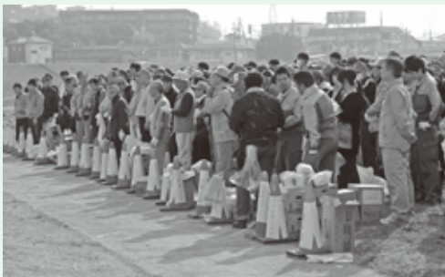
▲ふれあい広場に集合した参加者のみなさん

3月6日(日)、「大和川一斉清掃」と「水と緑の町づくり町民運動」(クリーンキャンペーン)が同日開催されました。当日は、好天に恵まれ汗ばむような陽気の中、大和川や町内各所で合わせて約5200名の方に清掃活動に参加していただきました。