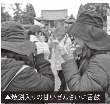
▲焼餅入りの甘いぜんざいに舌鼓