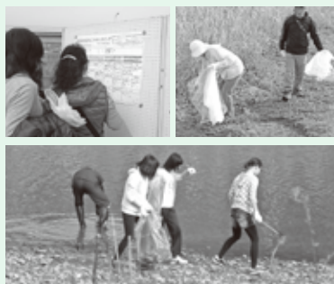
▲清掃活動とモニタリング調査の様子

「大和川一斉清掃」は、県内大和川流域の市町村において、地域住民・民間団体・企業等の方々が連携し、清掃活動を行うもので、今回は奈良県内の23市町村で実施され、8,500名を超える参加者がありました。