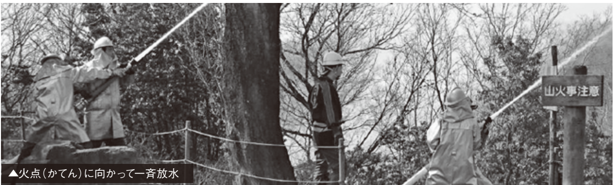
▲火点(かてん)に向かって一斉放水

消防機関では訓練等を通じて「もしまのとき」への備えを行っていますが、火災は何よりも予防が大切です。レジャー時の防火マナーと併せ、ご家庭の防火対策も確認しておきましょう。