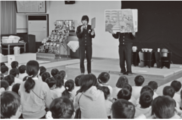
▲お巡りさんから交通安全ルールを教わりました

その後、年長さんを対象に行ったお茶会では作法を教わりながらお茶を楽しみ、西和警察署員や母の会の方ともコミュニケーションを取り、交流を深めました。