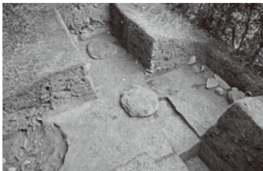
▲ 第4次調査で見つかった礎石と抜取穴

改めて発掘調査を行い、今年発見した礎石が何の建物跡にあたるかを解明したいと考えます。