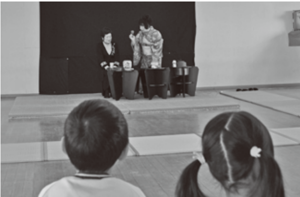
▲みんなで茶会を楽しみました