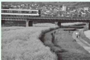
※写真はイメージです