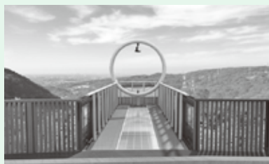
※写真はイメージです

観光振興事業 5,500万円 (H27年度3月補正) ※地方創生加速化交付金 (補助率10/10)が採択されました。