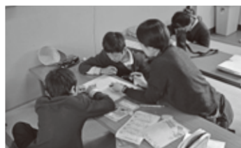
スタッフに教えてもらったり、友だちと相談しながら勉強!!