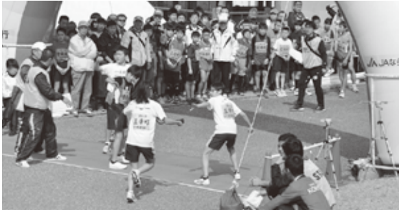
▲気持ちをこめてタスキをつなぐ!

当日、選手たちは多くの方からの声援を受け、全力を出し切り、町の部で1位(10年連続入賞)、総合で6位になりました。応援して下さった皆様、ありがとうございました。