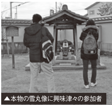
▲本物の雪丸像に興味津々の参加者