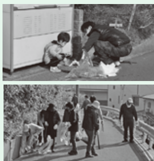
▲町内の清掃活動の様子

平成27年度は、11月が雨天中止となり、年3回の実施となりましたが、1年間で延べ1万5200名の方に参加していただきました。