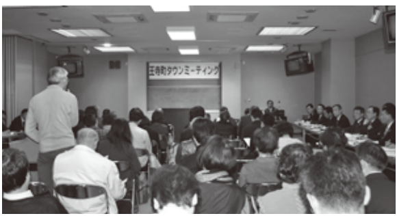
▲参加者のみなさんから多くのご意見・ご質問をいただきました

町長 子どもたちが一流の方々と触れ合うことは、非常に大事で、国や県とも連携し、機会をつくることを検討していきたい。