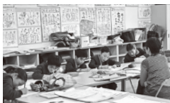
一年間一生懸命勉強してくれました