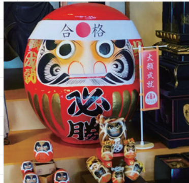
xiongguijiaenglizi1360さん # 合格だるま