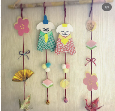
oji_sendentai_officialさん # つるし雛