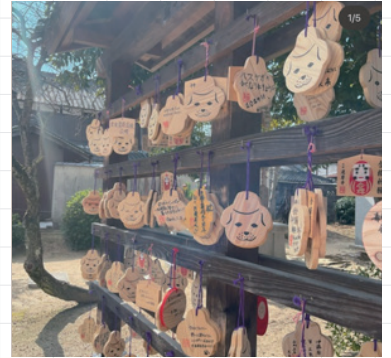
ojibiyori_officialさん # 願い札