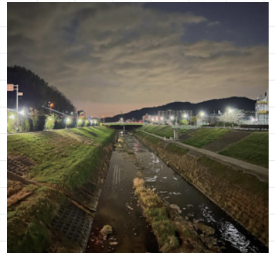
takehoshosさん # 葛下川