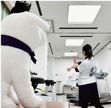
kumachan.camera.accountさん # 雪丸