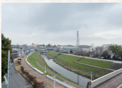
江戸時代に日見橋があったあたり

年(1836)に日見の橋を架け替えたことが記録されているものがあり、古い橋を撤去して仮設の橋を架けているとき、工事資金にするため、法隆寺の開帳(特別公開)期間中は1人銭2文ずつ橋の通行代金を徴収したとあります。わざわざ法隆寺の開帳に合わせていることからすると、聖徳太子が日の出を拝んだ場所にある橋だから架け替えに協力してほしいなどと言って、通行料を取っていたのかもしれない。