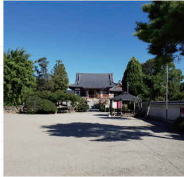
yukimarucyayaさん # 達磨寺