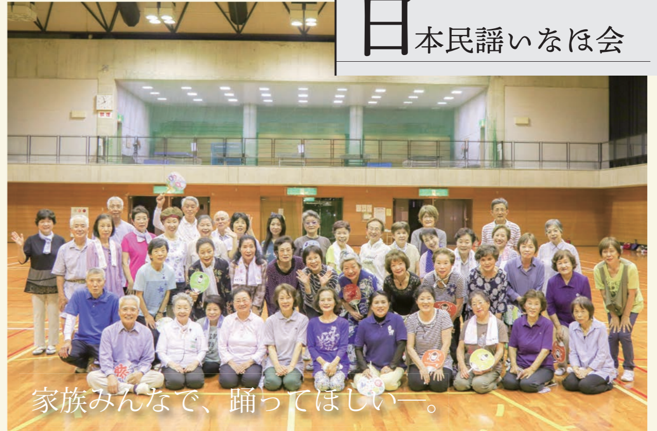
家族みんなで、踊ってほしい。