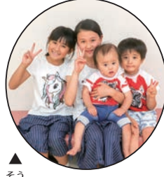
▲ そう 創 ちゃん・慎ちゃん(4才) 恵ちゃん(7才)・結ちゃん(10才) 4姉妹兄弟、 ずっと仲良しでいてね♡