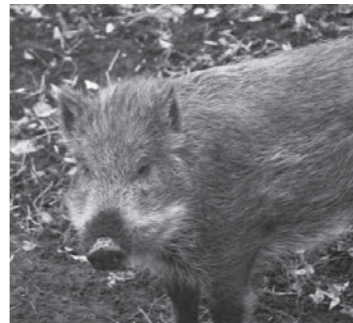
↑基本的には昼行性ですが、夜間に人里に下りてきて遭遇することがあり、注意が必要です

◇町公式サイトにイノシシに遭遇したときの対処法を詳しく掲載していますので参考にしてください。