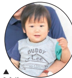
▲ ふうが 風芽 ちゃん 強くて優しい 男の子になってね！