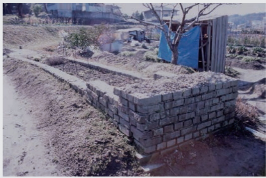
大和川唧筒からの水路跡(舟戸3丁目)

大和川と葛下川にはさまれた地域にたくさん水田があった久度では、江戸時代から水の確保に苦労しており、明治34年(1901)には蒸気唧筒を設置し、大和川の水を揚水して舟戸新池に貯水するようにしました。これが奈良県で初めてとなる灌漑