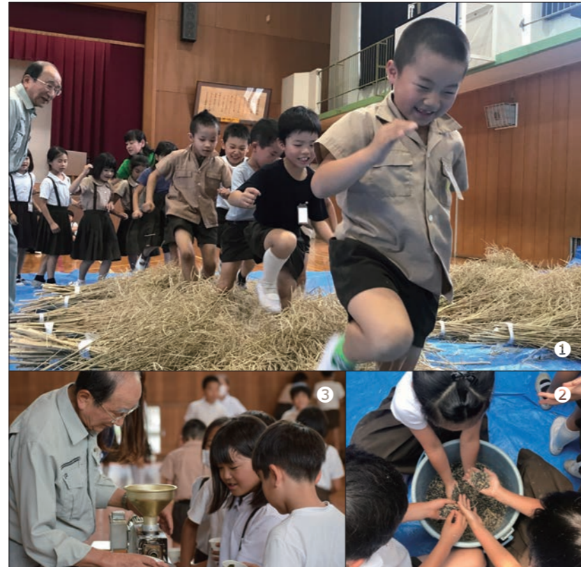
①踏んで踏んで！みんなで種落とし②落としあとの種③種を絞って油を抽出する機械に興味津々

6月11日(火)に王寺北小学校の4年生、6月18日(火)に王寺小学校の3年生、6月21日(金)に王寺南小学校の2年生をそれぞれ対象に、農業委員の皆さんが植栽された菜の花を使った菜種油の採取体験授業を実施しました。乾燥した菜の花から種を落とし、農機具で分別された種を機械にかけ、油を抽出しました。この油は秋の遠足で行く東大寺に奉納する予定です。