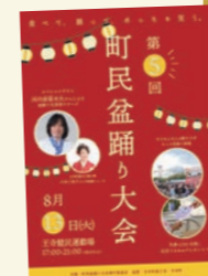
←盆踊り大会の詳細は公式サイトでも閲覧できます