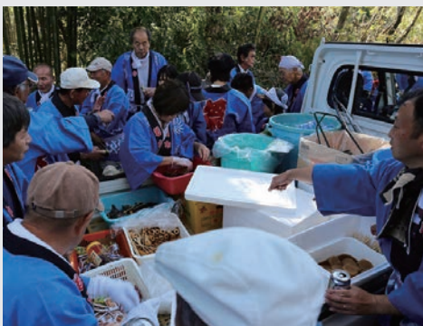
▲振る舞われるお酒やおつまみ

お祭りの形式は変化していますが、心躍らせながら祭りを楽しむ人々の気持ちはまったく変わりません。