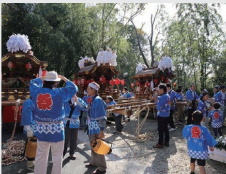
▲若宮水神社を参拝する3台の太鼓

太鼓台には車輪が付けられていて、大人が中心になって引き、子どもが太鼓台に乗って太鼓を打ち鳴らします。休憩時にはお酒やジュース、