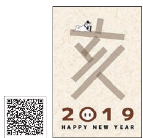
▲年賀状データを公式サイトでダウンロードできます。

●ありがとうございます。職員の手作りですが、公式サイト内でダウンロードできますので使っ