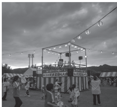
▲今年も、地域のみなさんと一緒に踊りましょう。