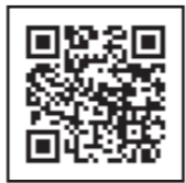
▲出展企業等詳細は上記のQRコードから