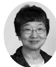
幡野 美智子 議員 (日本共産党)

王寺町地域防災計画について①「避難行動要支援者の個別支援計画」について②「個々の要望をふまえた避難所の整備」について③防災施設の整備方針で1.公園、緑地の整備2.河川の整備3.広域防災