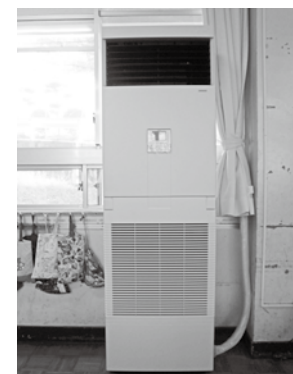
王寺小学校 王寺北小学校 王寺中学校 3年間のレンタル方式 6千11万3千円 6月3日 設置完了

昨年は、全国各地で記録的な猛暑が続き、熱中症の疑いによる緊急搬送が急増。今後も猛暑が予想され、児童生徒の安全安心の確保が急務であることから、義務教育学校開校まで3年間のみ使用となる王寺小学校、王寺北小学校及び王寺中学校を含め、全ての5小中学校の校舎にエアコンを設置