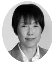
小山 郁子 議員 (日本共産党)

全国で悲しい児童虐待死亡事故が多発。H29年度の県こども家庭相談センターと市町村を合わせた奈良県における児童虐待相談への対応件数は、過去最多の3,888件。王寺町における児童虐待の把握と対処、防止対策について伺う。