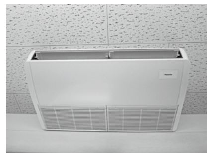
王寺南小学校 王寺南中学校 買取設置 1億5千660万円 6月3日 設置完了