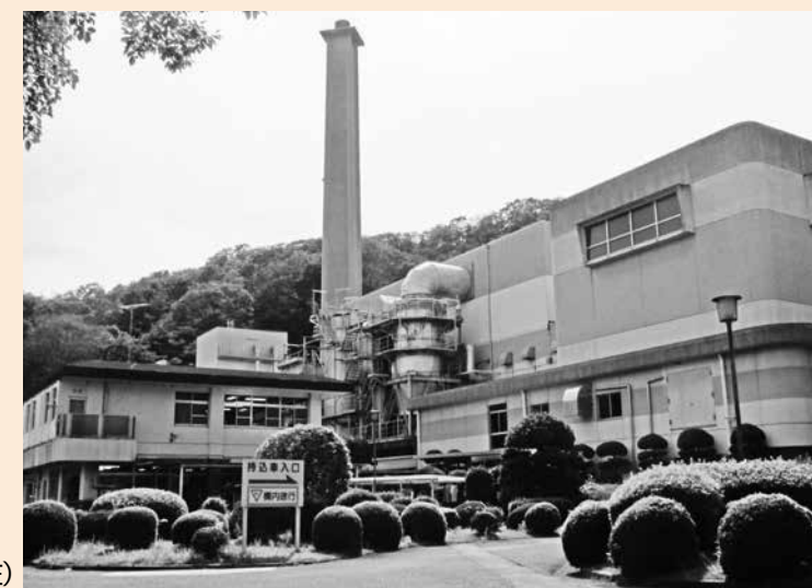
美濃園(令和元年6月現在)

平成31年2月に建設予定地(東側法面)の境界が確定後、現施設の都市計画決定区域と敷地範囲に一部ズレが生じていることが判明し、都市計画区域の変更を行う方向で進めている。