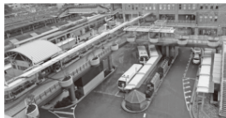
▲王寺駅 北側 (ペDESTリアンデッキ付近)