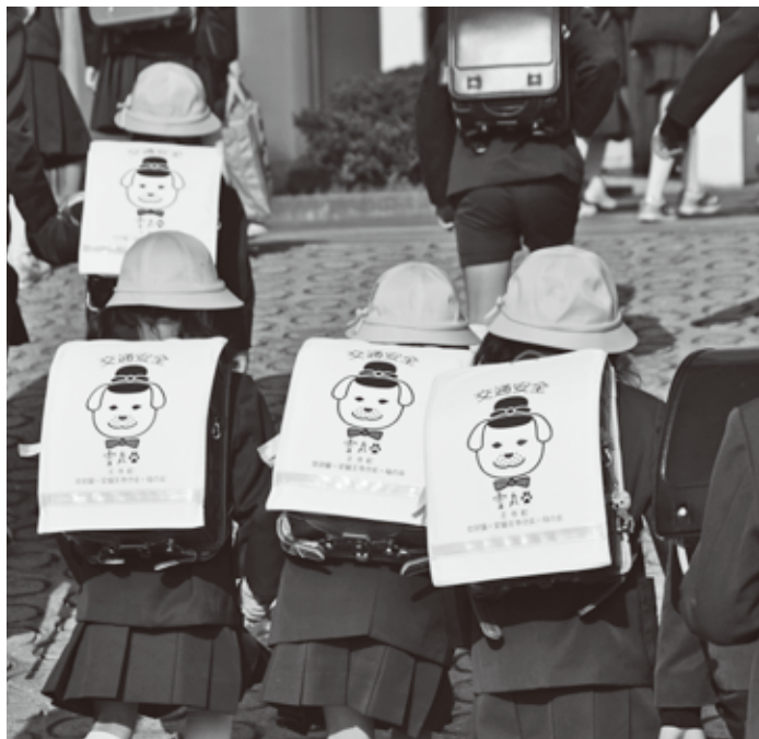
▲安全に通学できるように反射材付の「雪丸ランドセルカバー」を一年生に配布しました

今年は運動期間重点目標として、①自転車の安全利用の推進(特に、「自転車安全利用五則」の周知徹底) ②全ての座席のシートベルトとチャイルドシートの正しい着用の徹底 ③飲酒運転の根絶 ④二輪車、原付車の交通事故防止(奈良県重点)が掲げられました。