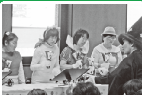
▲演奏曲に合わせたこだわりの衣装

3月16日(日)、やわらぎ会館多目的ホールで、王寺ハンドベルチーム・ピアチエーレによるハンドベルコンサートが開催されました。 今回は第10回という記念のコンサートでした。チーム発足12年の実力を感じさせるすばらしい演奏を披露されました。