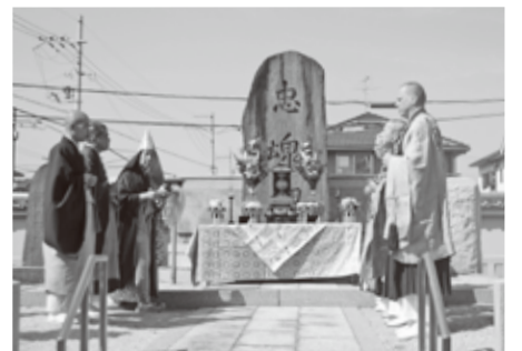
▲忠魂碑の前での法要の様子