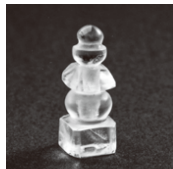
▲水晶でつくられた五輪塔

これらが納められたのは、石塔や水晶の五輪塔のかたちなどから、鎌倉時代のことだと考えられます。納められたときの状態が発掘調査で確認できたのは非常に貴重で、今年3月に遺物・遺構ともに奈良県指定文化財に指定されました。