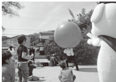
▲子どもも大人も釘付けの大道芸パフォーマンス