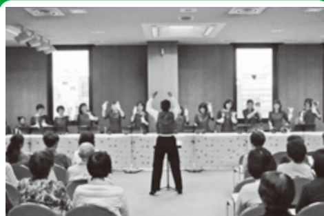
▲美しさと迫力を兼ね備えた演奏