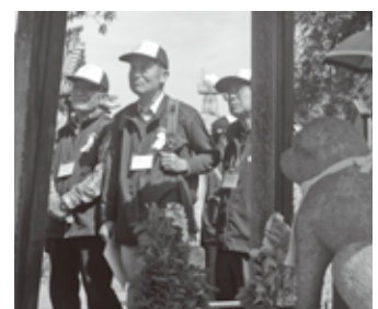
▲雪丸の石像の前で、達磨寺の歴史について学ぶガイドのみなさん