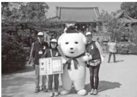
▲王寺観光ボランティアガイドの会の方々も参加