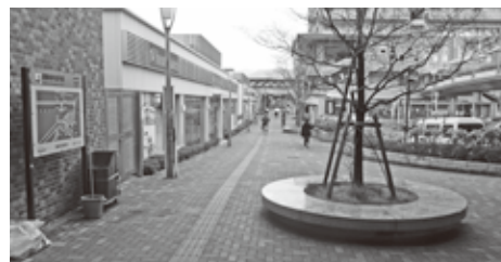
▲王寺駅 北側 (地上)