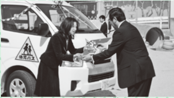
▲バスの鍵の進呈の様子

3月24日(月)、今年度から新しく導入される王寺南幼稚園の園バスの進呈式がありました。 式には、平井町長をはじめ、王寺町公式マスコットキャラクター「雪丸」も出席