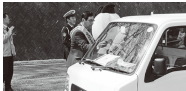
▲交通安全街頭広報で平井町長が交通安全を呼びかけました