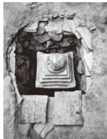
▲地下に納められていた石塔

なぜ石の下が空洞なのか、ふしぎに思っていたところ、石の隅に隙間があるのを見つけたので、小型カメラでなかをのぞくことにしました。すると、カメラモニターに石塔が写し出されました。石の下が空洞だったのは、石塔を納めていたからで、それを石で蓋していたのです。この発見は想像もしなかったことで、急遽、これを発掘調査しました。