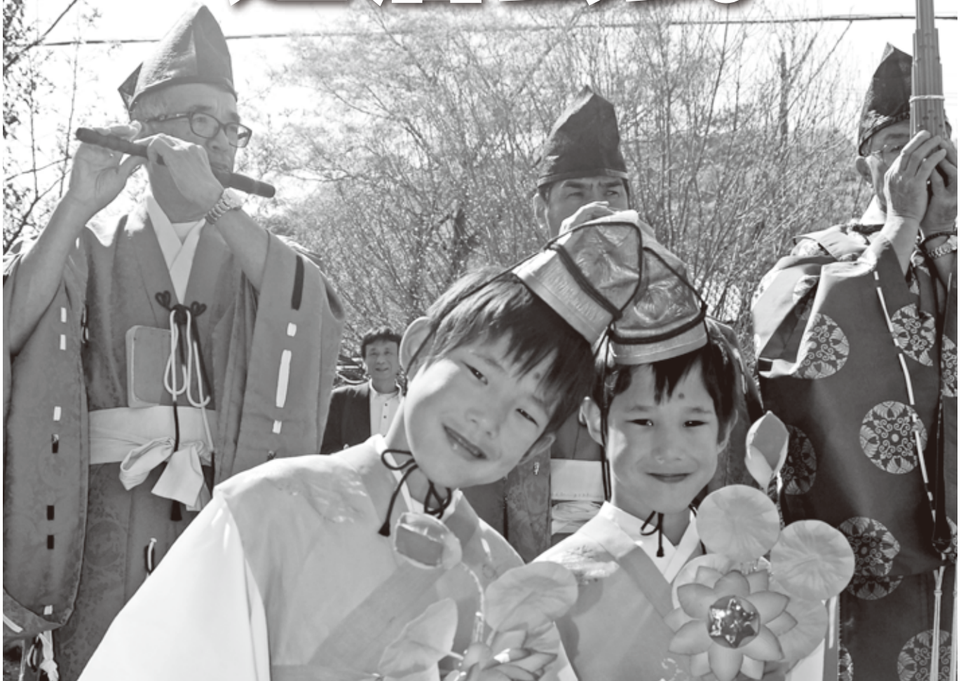
▲お稚児さんの衣装に身をつつみ、にっこり