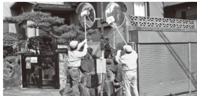
▲安協西和支部王寺町分会会員によるカーブミラー清掃の様子