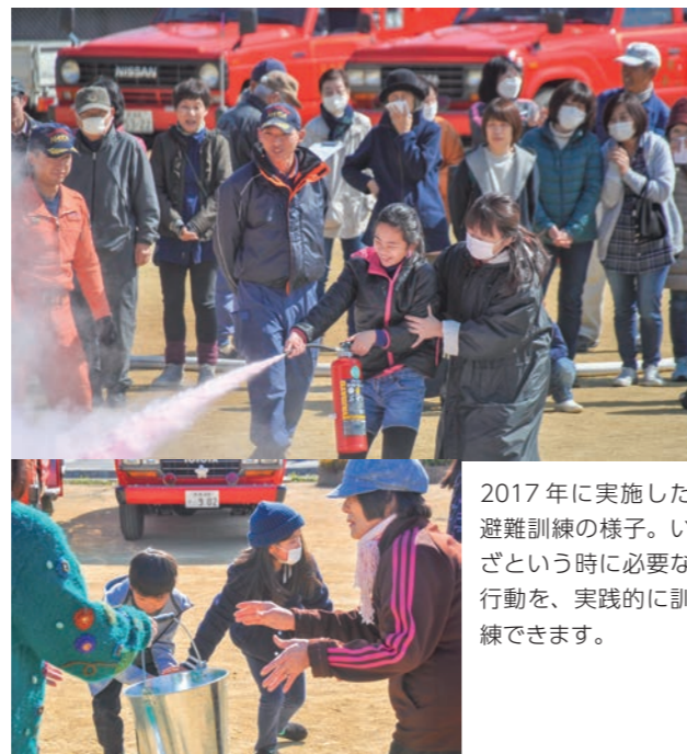
2017年に実施した避難訓練の様子。いざという時に必要な行動を、実践的に訓練できます。