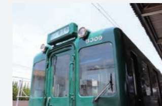
▲復刻塗装された列車は、近鉄新王寺～西田原本間を走行しています。

この助成事業は宝くじ受託事業収入を財源とし、コミュニティ活動と宝くじの普及広報を目的に助成される社会貢献活動です。