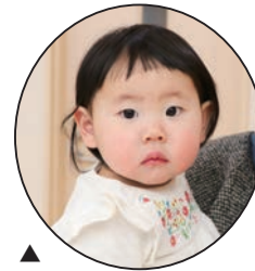
▲ はな 花ちゃん お兄ちゃんとずっと 仲良しでいてね