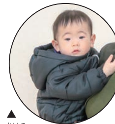
▲ かける 翔ちゃん 優しく、たくましく 元気に育ってね♡