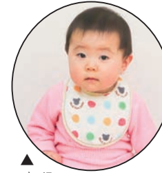
▲ きほ 来歩ちゃん ママとパパの宝物です きほちゃん大きいです