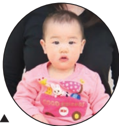
▲ みお 美桜ちゃん 毎日笑顔と幸せを ありがとう♡だいすき♡