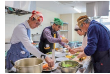
↑男の料理教室の一コマ。覚えてレシピを家庭で披露したり、食に対する意識が変わったりと、充実した学びを得る教室生の皆さん。

地域のさまざまな拠点で行われる教室。王寺町では、毎年多くの教室を開講しています。同じ興味を持つ、新しい友人との出会いもあるかもしれません。学習を通じて、地域のつながりを楽しんでみてはいかがでしょうか。 王寺で生涯学ぶ。 生涯学習。私たちの生活や能力向上・自己実現のために、自分に合った方法で生涯にわたって行う学習のことです。何かに興味を持ち、新しいことを発見し、吸収する学びは、知識や技術を高めるだけでなく、多様な価値観や生きがいを生むものとなるでしょう。