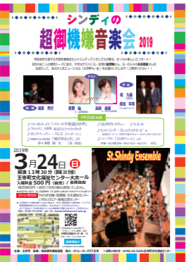
↑イベントの詳細は今号に挟み込んでいます。