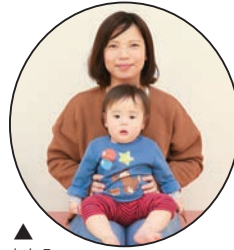
▲ わたる 航ちゃん たくさん食べて元気 いっぱい育ってね◎