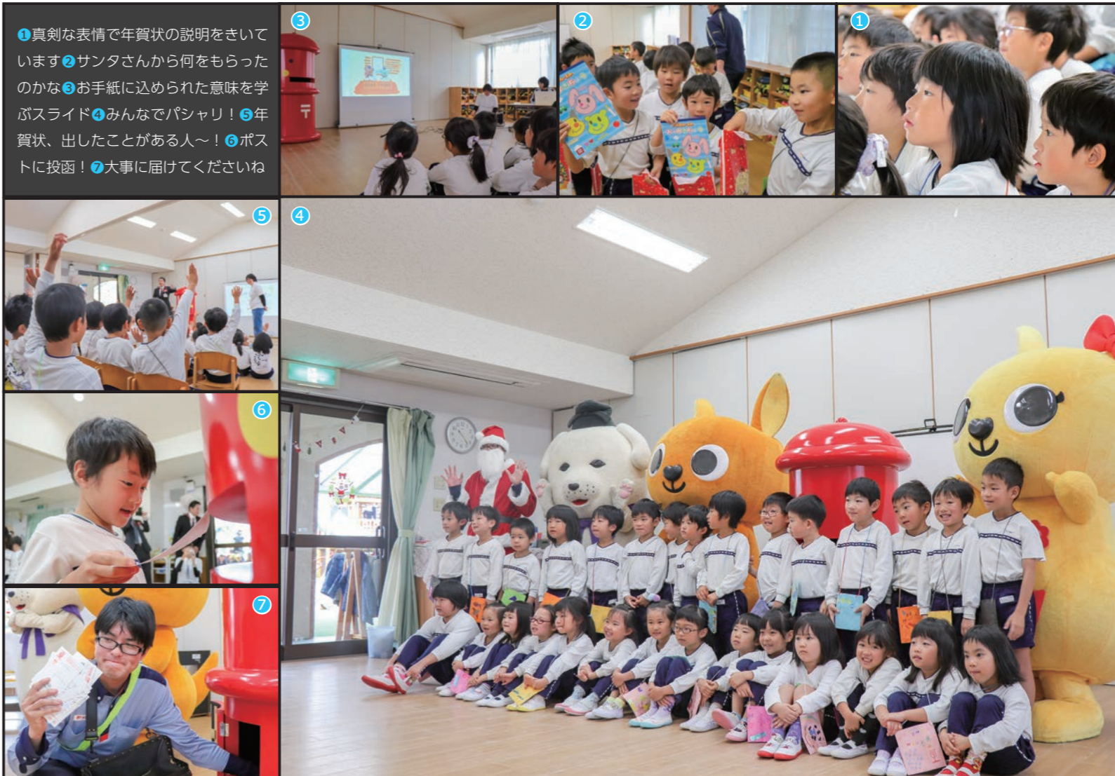
①真剣な表情で年賀状の説明をきいています②サンタさんから何をもらったのかな③お手紙に込められた意味を学ぶスライド④みんなでパシャリ！⑤年賀状、出したことがある人～！⑥ポストに投函！⑦大事に届けてくださいね