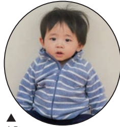
▲ まる 丸 ちゃん みんなを笑顔にして くれてありがとう！