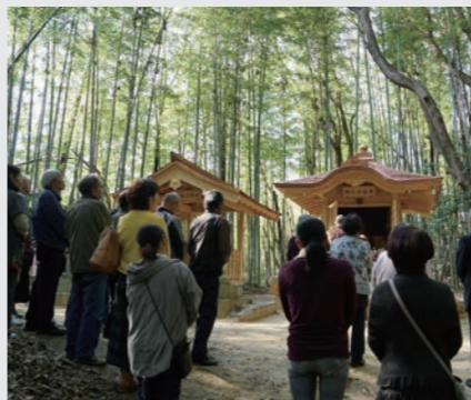
▲興仁不動堂・愛宕神社開眼法要の様子

愛宕さんの石碑は、江戸時代の弘化2年(1845)のもので、不動さんの石仏はさらに古