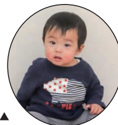
▲ はる 華 ちゃん 元気に生まれてきて くれてありがとう！