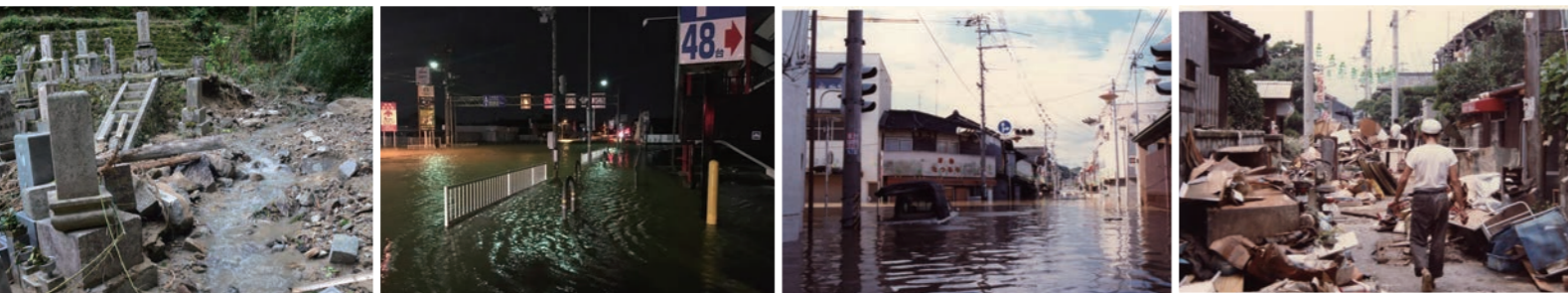
東日本大震災の様子