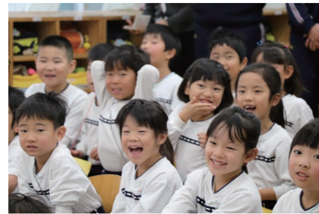
▲サンタさんらゲストの登場に満面の笑み

11月11日(日)、町内全域で自治会を中心にクリーンキャンペーンが実施されました。散乱ごみを拾ったり、落ち葉等でうまっていた通路や溝のごみを一掃し、自治会員や協力業者など約4,500名の皆様のご協力によって回収されたごみは30トンでした。今後も、「きれいな町づくり」へご協力をよろしくお願いいたします。