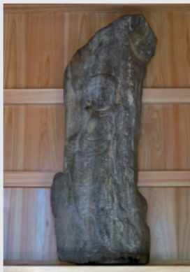
▲鎌倉時代頃の興仁不動石仏

真新しいお堂に集う人の姿を見ると、古い石仏や石碑が長く伝えられてきた理由がよくわかります。