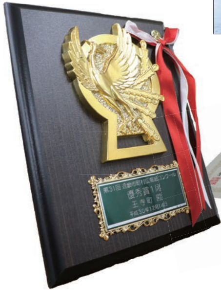
↑受賞した2つの賞の盾と賞状。これらの賞は、地域の皆さんとの協働の活動による成果として認められた賞です。

地域・行政で積み重ねてきた実績が認められた結果であり、たいへん嬉しく感じています。 本年には今後の王寺町の10年間の方針を定めた『総合計画』が完成します。地域におけるさまざまな課題に対して、適切な役割分担のもと、その解決に取り組むことができるよう、住民と行政の協働（パートナーシップ）によるまちづくりを基本に、これからも引き続き、皆さまとともに王寺の未来・発展に全力を尽くしてまいります。 結びに、本年の皆さま方の益々のご健勝と、ご多幸をお祈りし、年頭のあいさついたします。