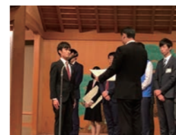
↑表彰を受ける若手職員

大賞になった「王寺らーめんトライアル事業」は、王寺駅北エリア内の賑わい創出を目的に、新規起業を目指す人に、空き店舗を活用して期間限定のチャレンジショップの場を提供した事業。その独自性や、事業を活用した人が、期間終了後に実際に当エリア内でラーメン店を開業されたという実績が評価されました。